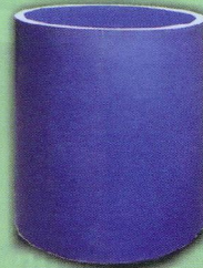
نمونه ستون سنگی از سنگهای مصنوعی