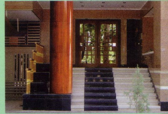
نمونه ستون کار شده از جنس تراورتن قرمز