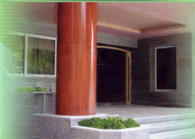
▲ نمونه ستون کارشده از جنس تراورتن قرمز