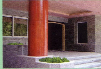
نمونه ستون کار شده از جنس تراورتن قرمز